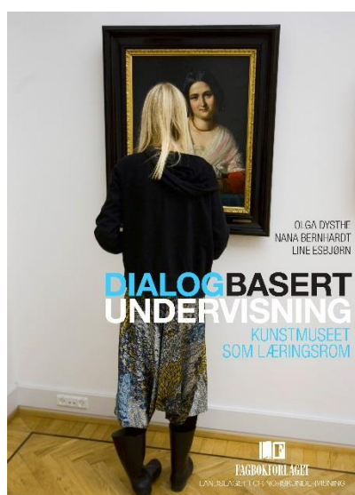
Olga Dysthe, Nina Bernhardt og Line Enskjønn (2012) Dialogbasert Undervisning. Kunstmuseet som læringsrom Bergen: Fagbokforlaget.

Til slutt et lite hjertesukk: I en bok om formidling til barn og unge, der både språk-utvikling og formuleringsevne er viktige momenter, hadde jeg ønsket meg en mer presis og velformulert språkføring. Teksten skjemmes i særlig grad av de språklige «virus»: Fokus og I forhold til .