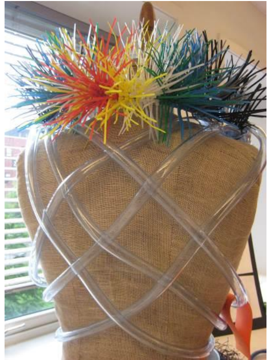
BILETE 1 OG 2: To kroppssmykke i metall og plast. Klave (til venstre) og Kropp (til høgre). Studentarbeid vist på Jubileumsutstillinga 2010.