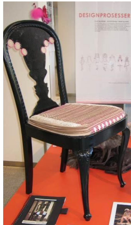
BILETE 5 OG 6. Diadem av sprøytespissar (til venstre). Stolfabulering (til høgre). Studentarbeid vist på Jubileumsutstillinga 2010.

Lærer 1 skildra studentgruppa som flinke til å bruke seg sjølve, utvikle det dei dreiv med og ikkje vere så avhengige av å få godkjenning av lærar. Studentane var meir sjølvstendige og vågde å stole på egne stemmer. Men fleire studentar som kom rett ifrå vidaregåande skule sleit, fordi dei hadde lite utvikla arbeidsteknikk. Nokre vart fort ferdige. Dei tenkte ikkje på kva dei kunne gjere og korleis dei kunne utvikle arbeidet vidare. «Hvis de da ikke fikk en skikkelig dytt på det» (L1). Studentane måtte få opplæring i å arbeide eksperimentierende og problemløysande. Det var mange som ikkje forstod korleis denne arbeidsmetoden var. Studenten fekk fridom til å tolke og utvikle oppgåver og tema gjennom material på ein personleg og estetisk måte. Det individuelle preget førte til nyutvikling av materialbruk og teknikkar. Det vart lagt større vekt på idéen bak arbeidet enn på flid og nytte, og den kritiske vurderinga av eige arbeid vart viktig. Lærer 1 karakteriserte og skildra tida og undervisinga med tre fyndord; kreativ, estetisk og innovativ .