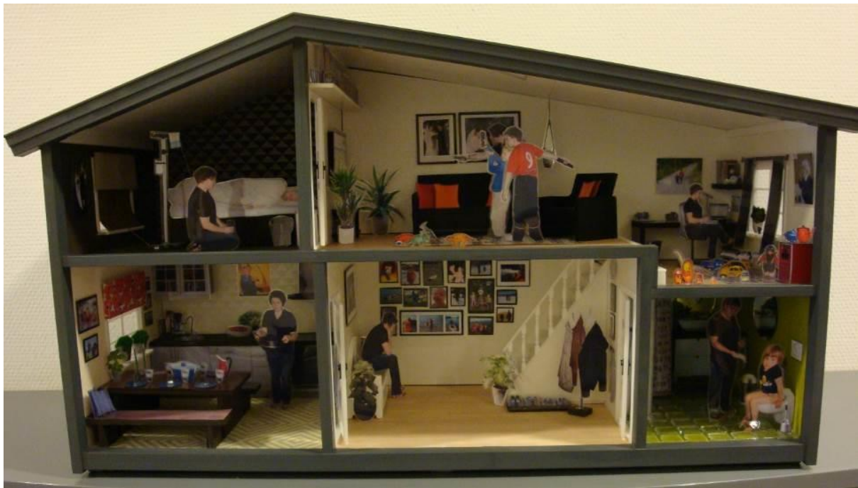
BILETE 3 «Bak fasaden» foto, bildebehandling og plastlaminering, 60 x 45 x 25 cm. Studentarbeid. Jubileumsutstillinga, 2010.

På jubileumsutstillinga i 2010 var det fleire studentarbeid som viste digitale arbeid som bilete, video eller som designverktøy for arbeid i material. På dokkehuset «Bak fasaden» (bilete 3) er det nytta digitale verktøy som digitalt kamera, bildebehandlingsprogram og printer kombinert med plastlaminering. Tekstil som material er fråverande, men er viktig i konseptet «Bak fasaden» gjennom interiør, fargeval og synleggjering av kvardagshendingane. I «Dame med tastatur» (bilete 4) er lin grunnlagsmaterialet. Det er brukt silketrykk, digital transferteknikk med overføring av bilete og til slutt handbroderi for å framheve tastaturet. Studentane vart oppmuntra til å kombinere teknikkar og reiskap i eksperimenteringa.