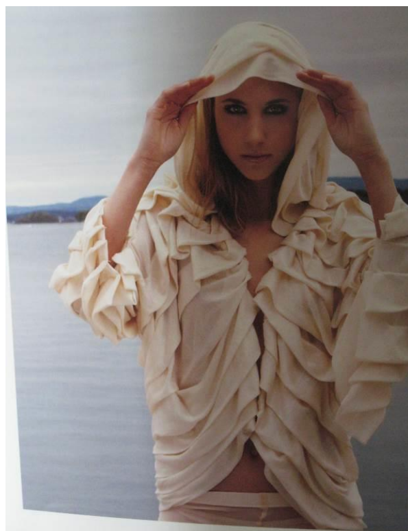
BILETE 9 OG 10. Studentarbeid, katalogar frå studiet Mote og produksjon. Jubileumsutstilling 2010.