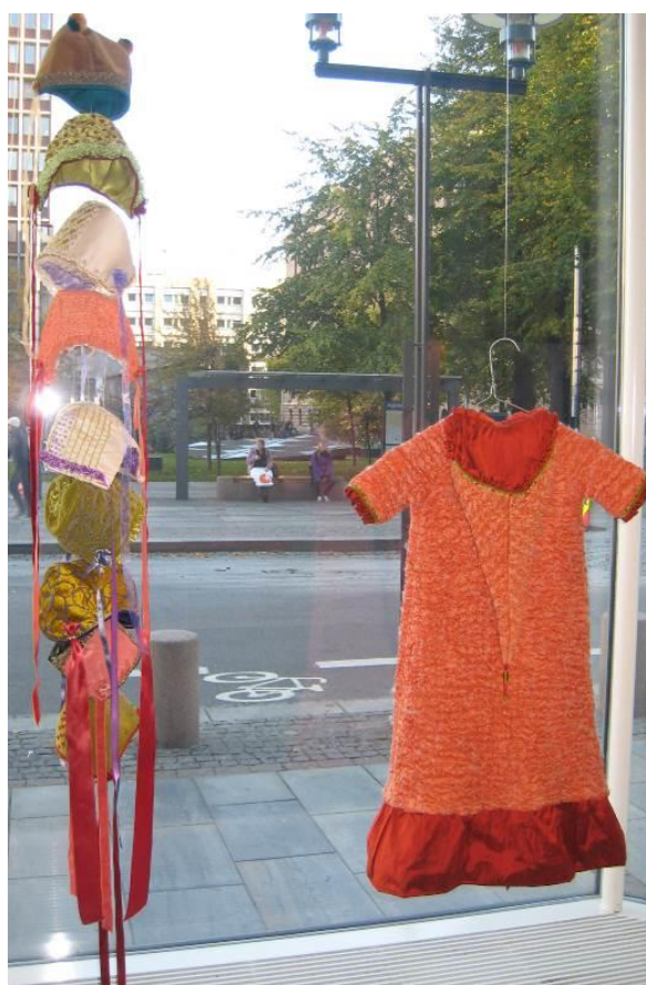
BILETE 7 OG 8. «Askefast», kjole i bretteteknikk (til venstre). Dåpskåpa og dåpsluer, silke, ull og broderi (til høgre). Studentarbeid. Jubileumsutstillinga 2010.