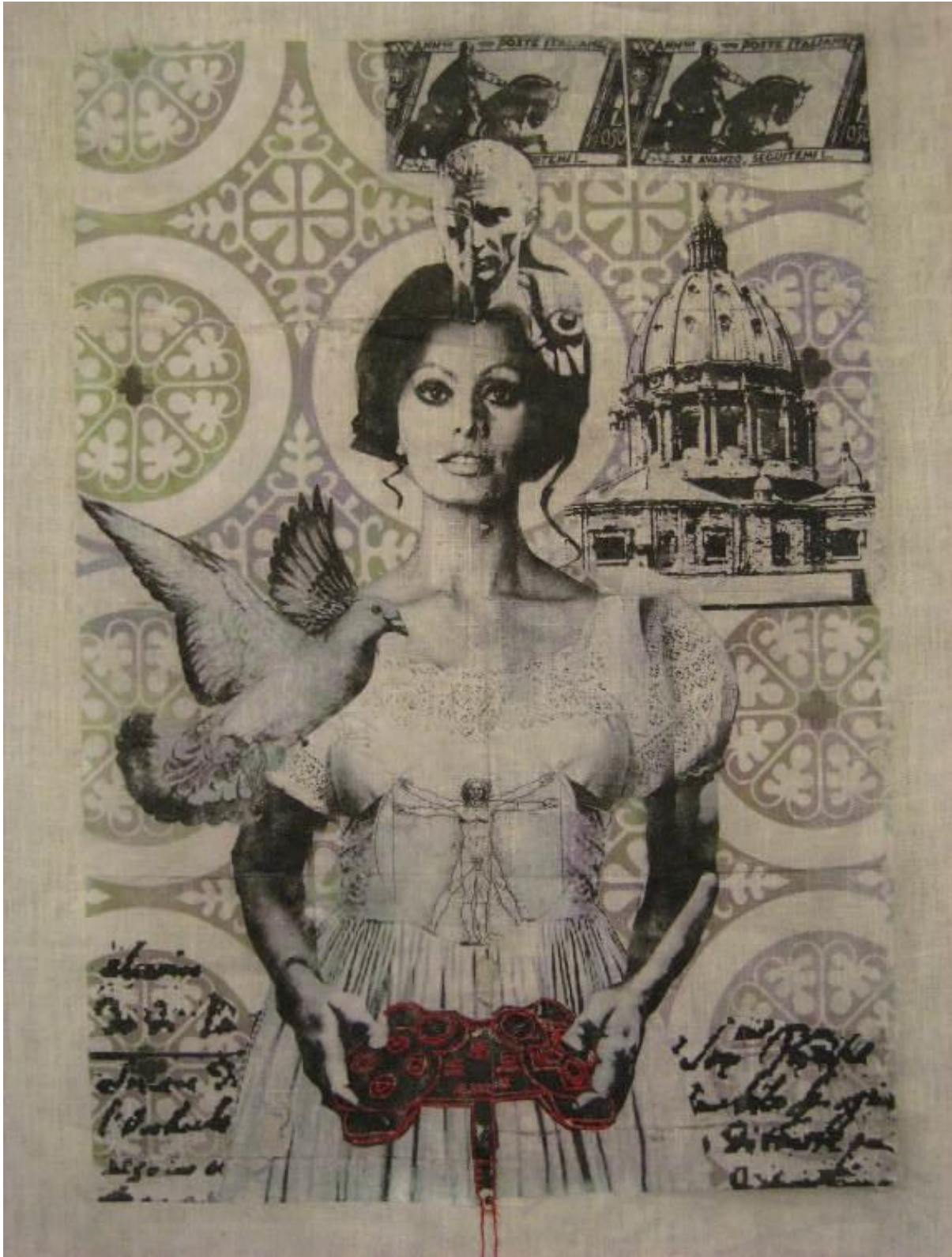
BILETE 4. «Dame med tastatur» tekstilcollage på lin, transferteknikk og broderi, 100 x 60 cm. Studentarbeid. Jubileumsutstillinga, 2010.