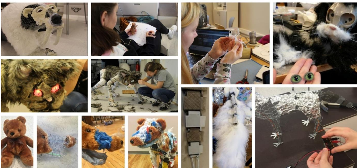
BILDE 2. Arbeid med lysende laserauger, bamse transformert til plasthund, demontering av elektroniske leikedyr, 3D-print av fiskehale, programmering av rørslø i hovud og ledda hale.