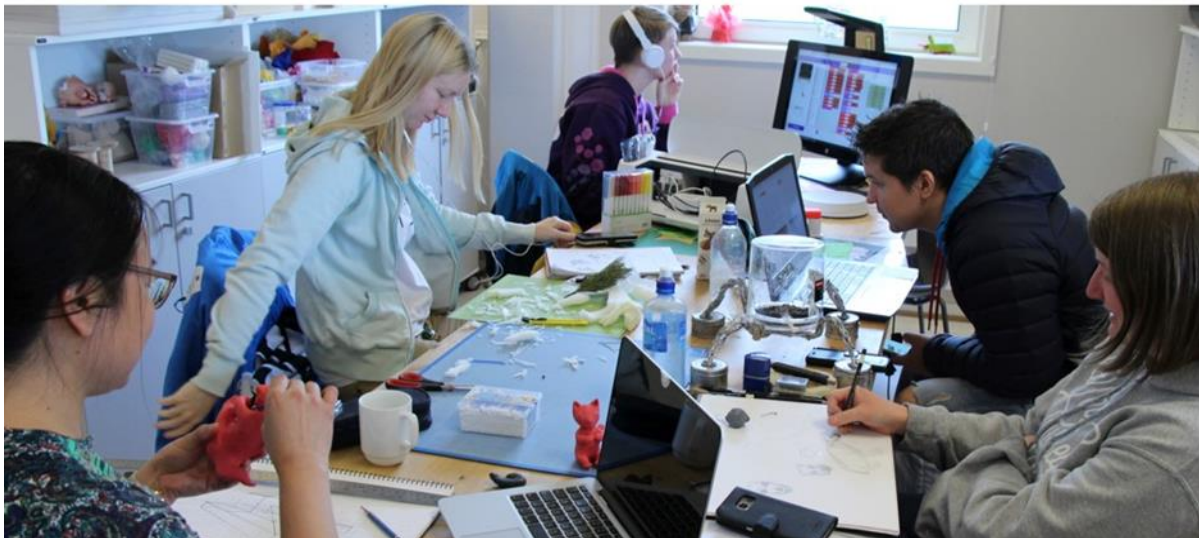
BILDE 1. Felles ideprosess, Skaparverkstad, 2019.