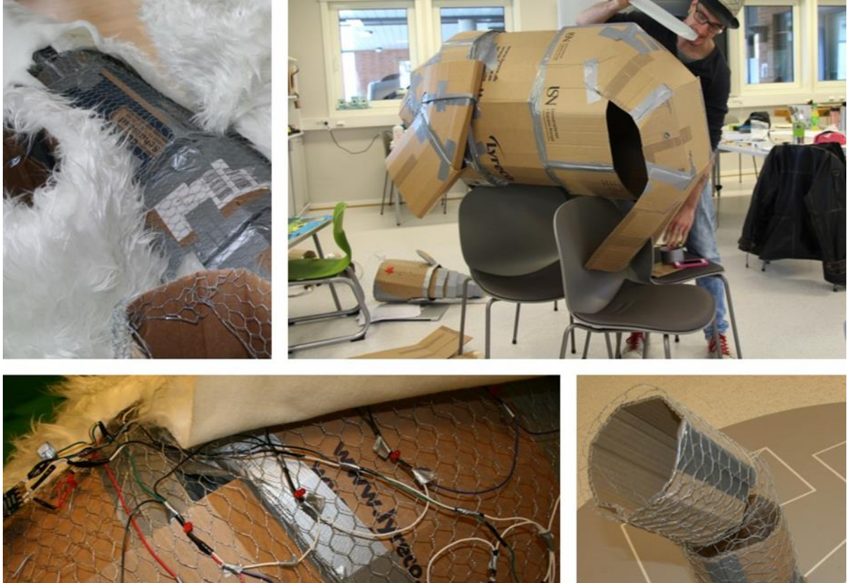
BILDE 3. Ein isbjørn blir til, med nettverk av lys under fuskepelsen.

I mengda av gode løysingar kunne me valt å trekke fram fleire, men av omsyn til den tilmålte plassen i artikkelen gjer me eit utval ut ifrå den største og den minste løysinga. Desse to er fine kontrastar på fleire måtar og dekker godt breidda i det som utspelte seg i perioden.