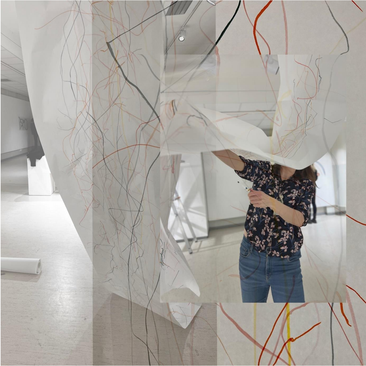
Figur 4. Flying with friends 1.