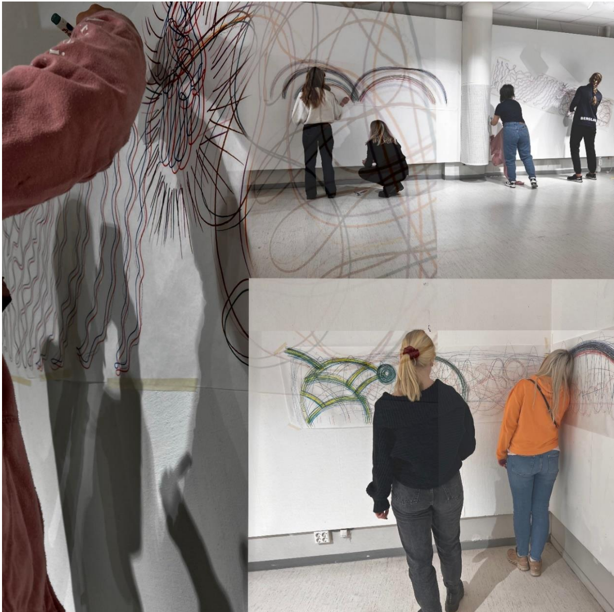
Flying with friends 2.