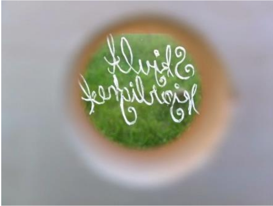
Bilete 7: Fuglekassa sett frå inngangsholet til fuglane.

Denne studenten viser bevisstheit om dei ulike modalitetane og dei meningsskapande ressursane, og då byrjar den vekselverkande skapande prosessen å skyte fart: