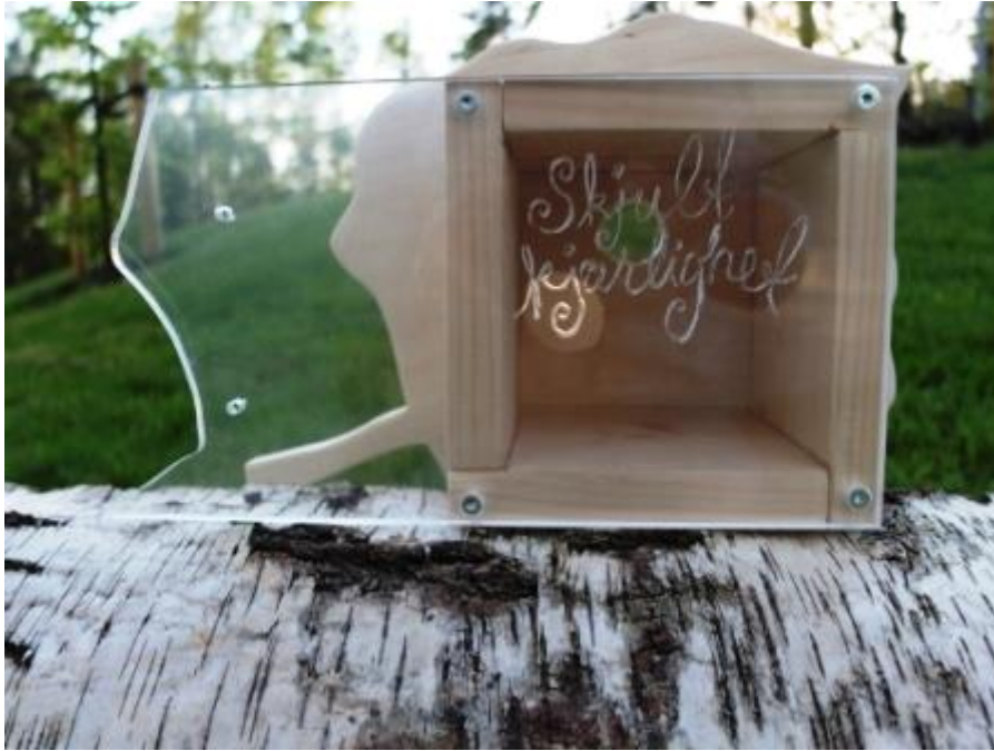
Bilete 6: Fuglekassa sett frå vindaugget.

Studenten skriv vidare om korleis ho arbeider med modaliteten tekst, og gjer reflekterte val i høve til denne konkrete kommunikative situasjonen. Ho gjer bruk av intertekstualitet som eit relasjonelt grep: