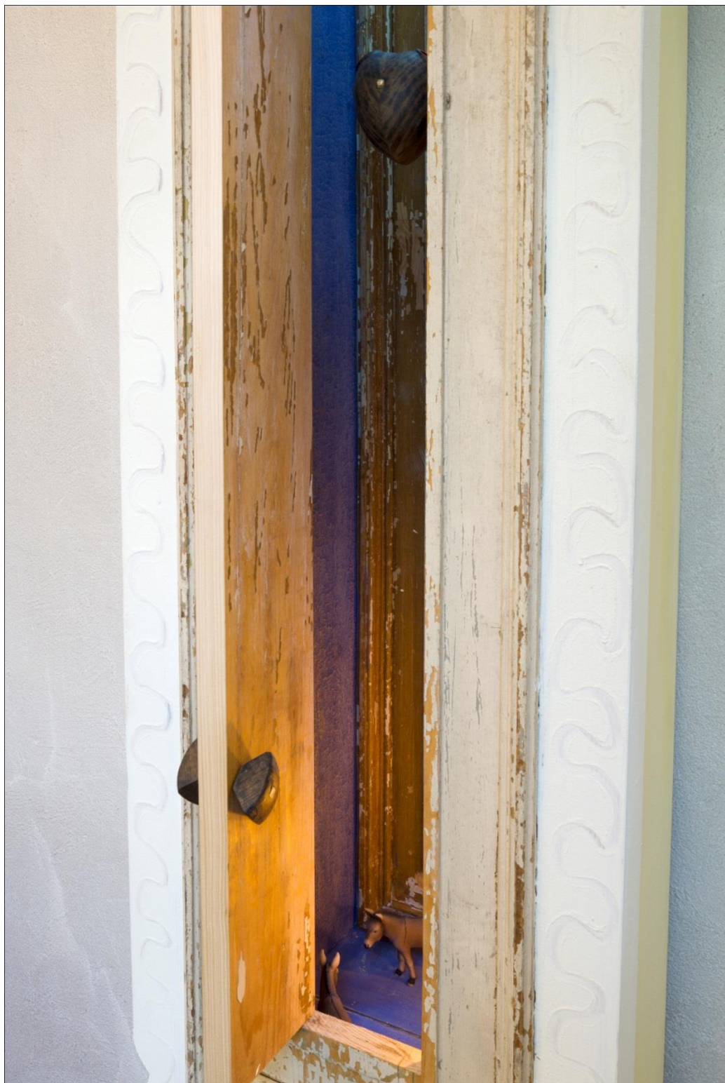
Bilete 5: Detaljar frå skåpet Korsfestelse .