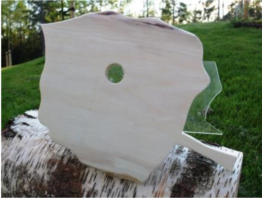
Bilete 8: Framsida på fuglekassa: PIP-show.

Kort oppsummert syner dette studenteksemplet korleis omgrepa handlingsramme, meiningspotensial, modalitetar og meiningssskapande ressursar kan nyttast i praksis. Omgrepa tener til å skape bevisstheit for den som skaper om kva ein skal gjere og korleis ein kan få dei ulike modalitetane til å samverke og kommunisere med mottakarar.