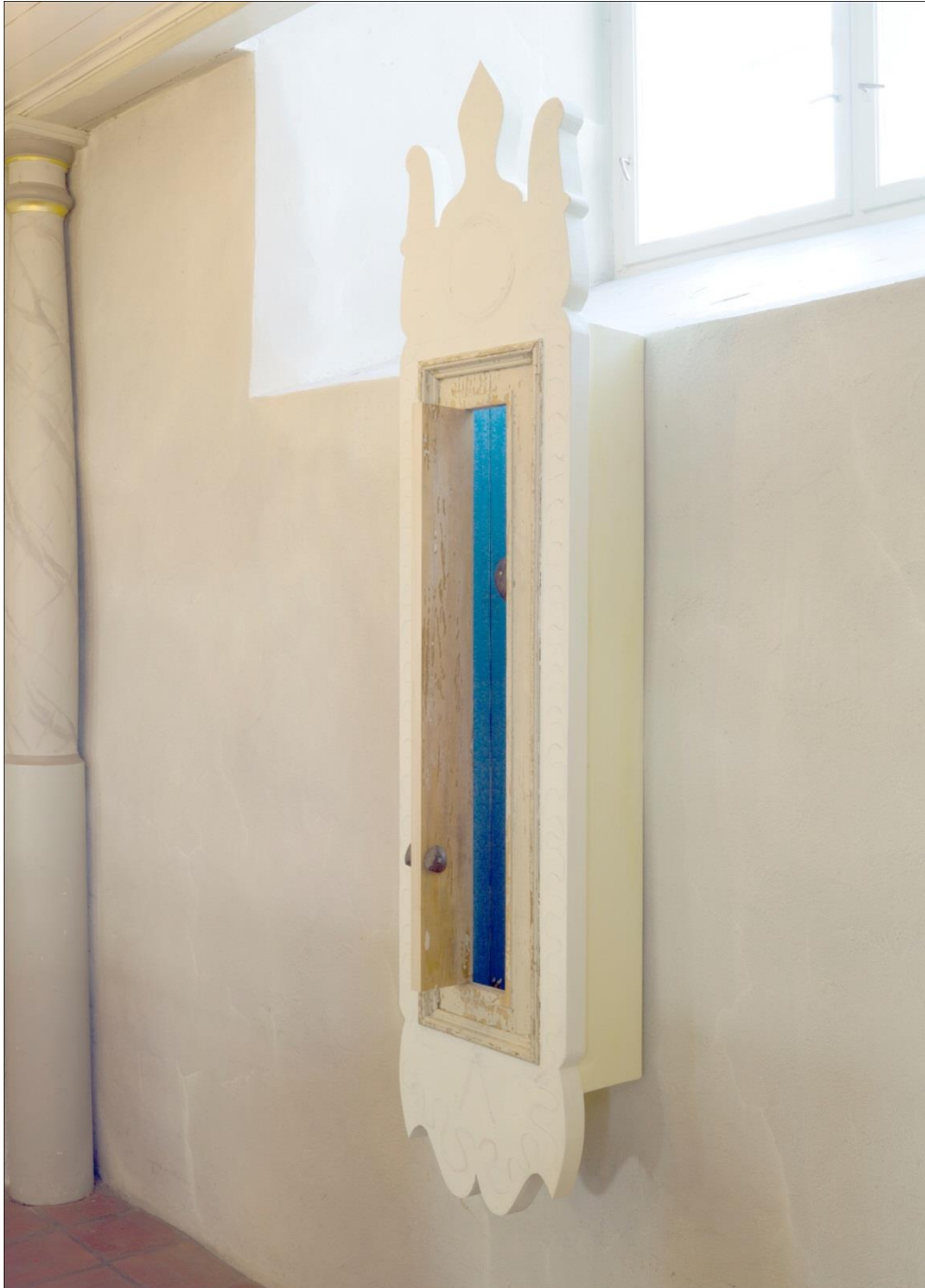
Bilete 4: Skåpet Korsfestelse med opna dør.

I biletet nedanfor (bilete 3) er skåpet opna og ein kan sjå at lyset frå vindaugget graderer blåfargen frå lyst til mørkt. Målinga er her ein modalitet som samverkar med rommet (lyset) som er ein annan modalitet. Moglegheita for interaktivitet gjennom at mottakarane kan opne og lukke døra i skåpet fungerer her som ein meningsskapande ressurs.