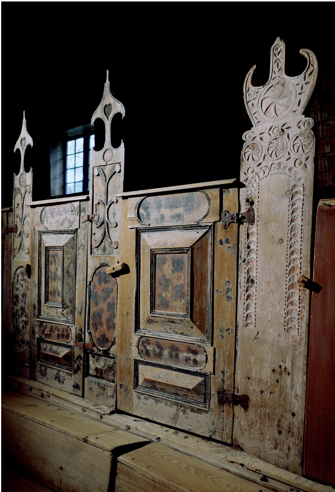
Bilete 2: Kyrkjebenkvangar og dører i Gaupne gamle kyrkje frå 1661–65 (foto: Jiri Havran, publisert med løyve frå fotografen).