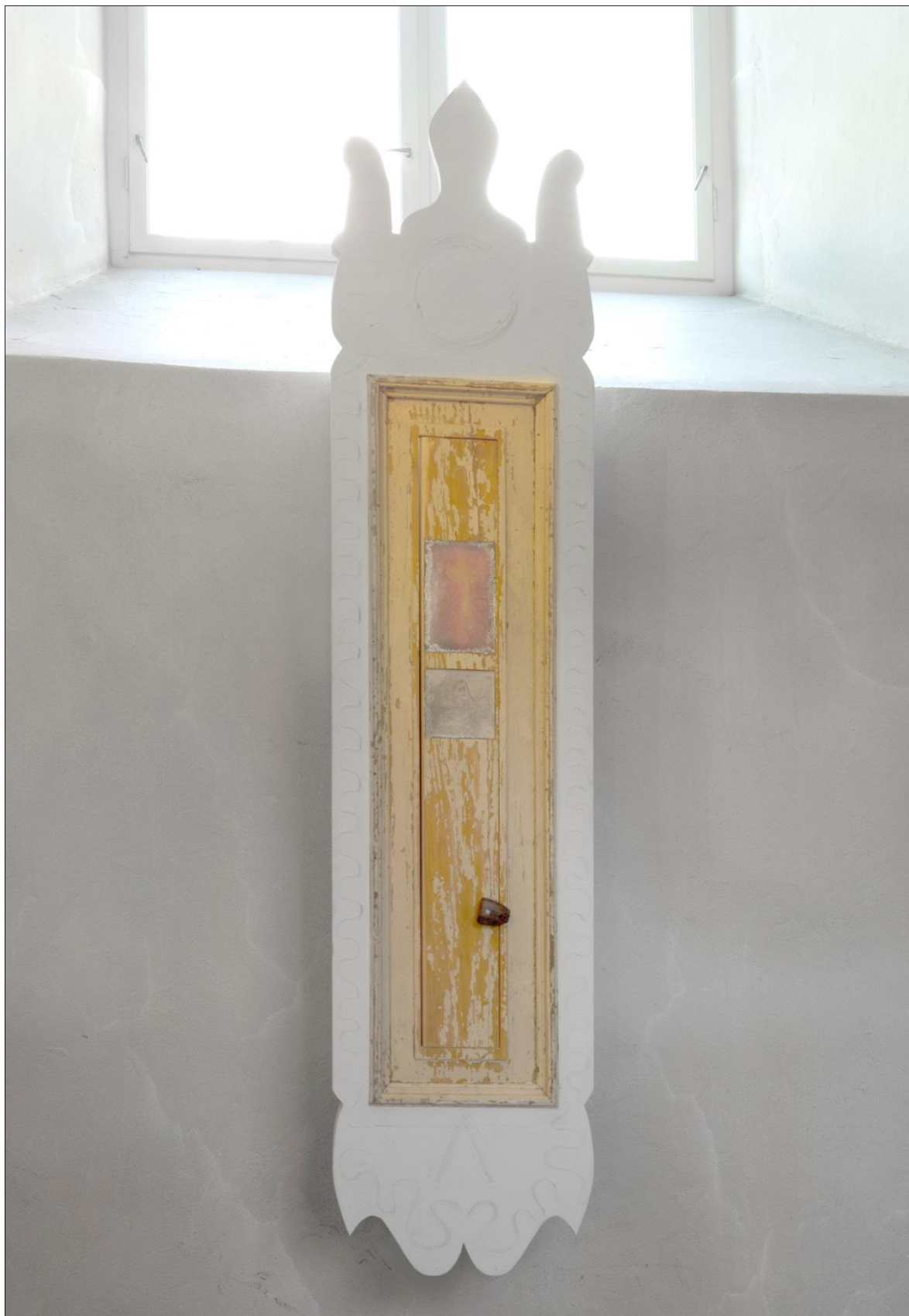
Bilete 3: Skåpet Korsfestelse .