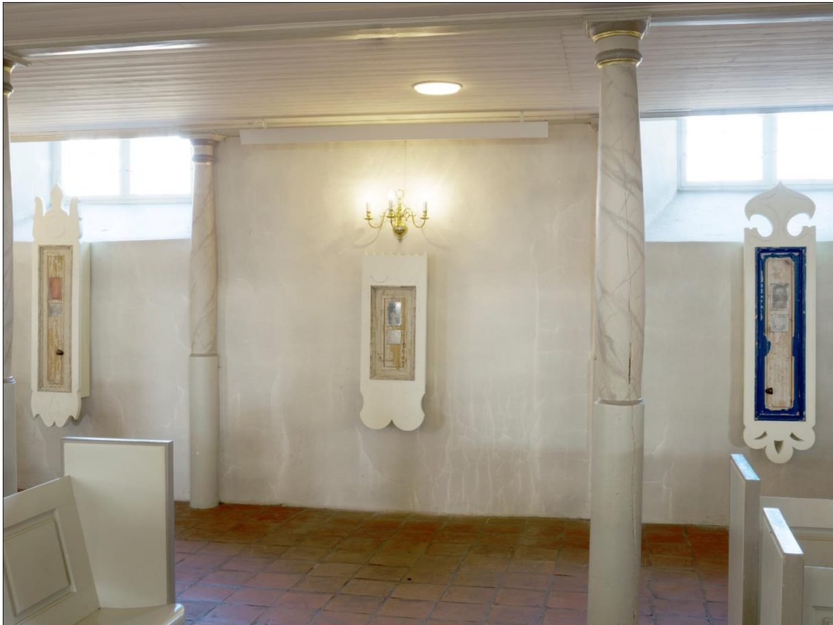
Bilete 1: Skåp i nordre korsarm.

sidealter i mellomalderkyrkjer, blei det naturleg å velje skåp som handlingsobjekt til dei to korsarmene (sjå bilete 1 nedanfor).