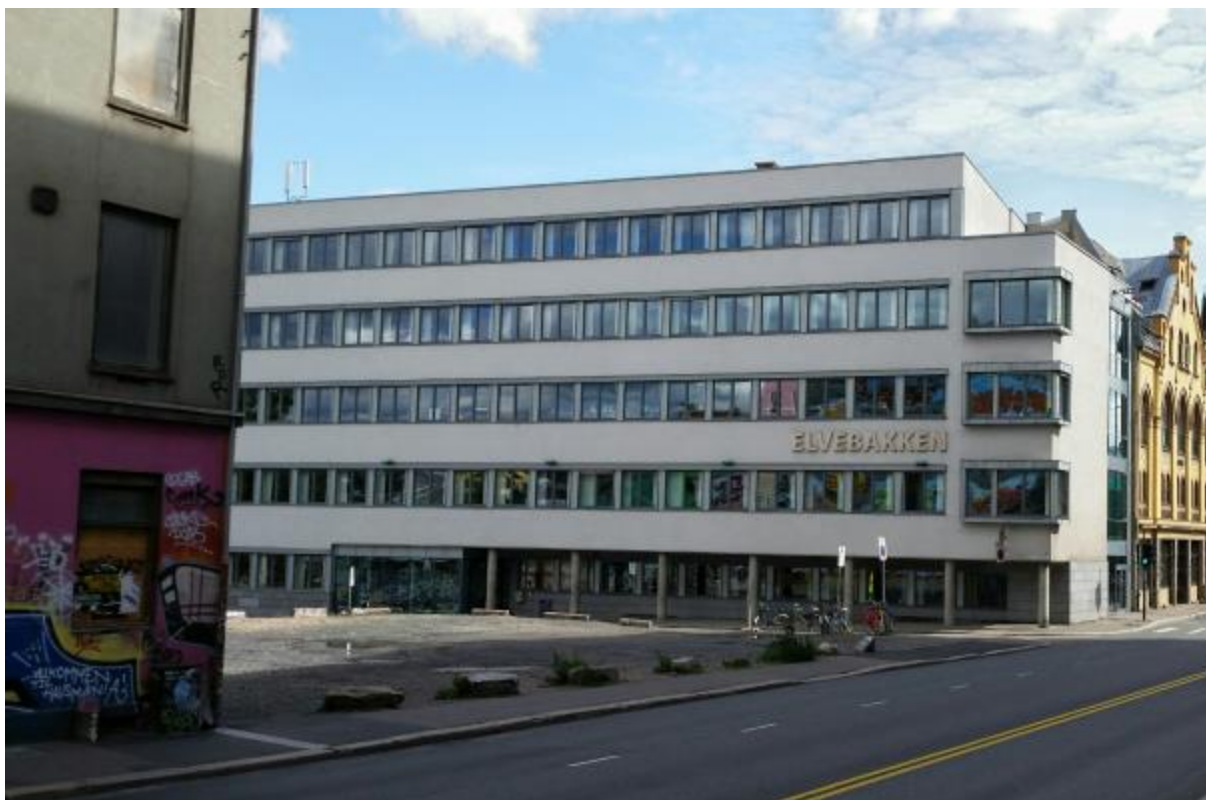
Figur 6: Elvebakken videregående skole - lokalisert i Oslo sentrum.

I SINTEF-rapporten Ettrevaluering av byggeprosjektet Kvadraturen Skolesenter blir det oppgitt at: “elevene ville ha en sentrumsnær skole med gode lærere og et bredt faglig miljø” (Klakegg & Nordmark, 2004:27). Forestillingen om at sentrumsskolene får de beste lærerne er godt forankret. Sentrumslokalisering av skolene gir en positiv pedagogisk effekt på grunn av bedre utdannede lærere, som igjen gir bedre kvalitet i undervisningen (Beck, 2008; Solstad, 1978). Denne effekten blir, som nevnt, ytterligere forsterket ved at sentrumsskolene foretrekkes av teoretisk sterke elever. Almlid (2006) setter tendensen i sammenheng med fritt skolevalg. Jeg ser prinsippet om fritt skolevalg som en underliggende struktur som forsterker de mekanismene som spiller inn. Blant annet er konkurransen om elevene mellom de videregående skolene hard, og da handler det, som “gymnasieforsker” Ane Qvortrup ved Aarhus Universitet formulerer det, om å få så mange av de riktige elevene som mulig (Henriksen, 2012). Med konkurranse skolene imellom og vektlegging av resultatoppgjør, kan sentrum være et hensiktsmessig lokaliseringsvalg der “rekrutteringskortet” er effektivt å dra opp som argument.