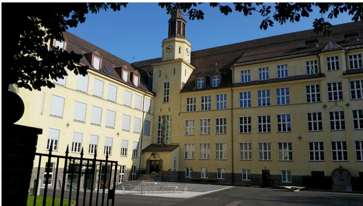
Figur 4: Hersleb skole på Tøyen i Oslo sentrum ble gjenåpnet i 2014 som Hersleb videregående skole. Den bevaringsverdige bygningen er totalt rehabilitert og modernisert innvendig.