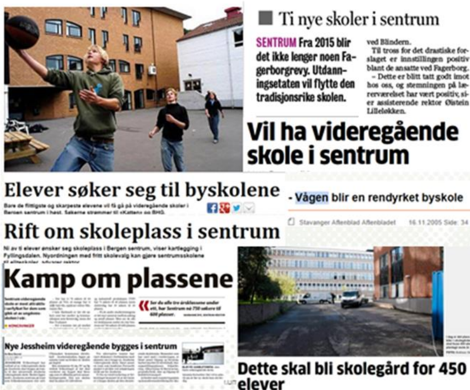
Figur 5: Byskoler og skoler i sentrum i avisoverskrifter (Collage: E.M. Lefdal)

“Dagens ungdommer søker seg til sentrum når de velger videregående. Dermed sliter mindre sentrale skoler med rekrutteringen. – Vi vil derfor konsentrere oss om de videregående skolene i sentrum“ (Fjellstad, 2011). Konsekvensen av en slik unyansert holdning kan være at de desentraliserte skolene, i tillegg til å ha en “uheldig“ lokalisering, ikke blir prioritert når det gjelder ressurser til vedlikehold, innhold og fagtilbud, etc. Da kan det fort danne seg A- og B- skoler. Det kan synes som at enkelte argumenter for sentrumslokalisering av videregående skoler forankres i at ungdom i utgangspunktet søker mot sentrum.