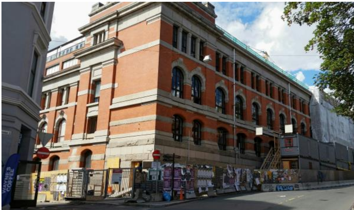
Figur 3: Tidligere Statens håndverks- og kunstindustriskole i Oslo sentrum blir totalrehabilitert. Her åpner Edvard Munch videregående skole i 2015.