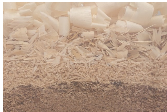
Figur 2. «Flis». Flis av ulike treslag, tilvirket av forskjellige verktøy og lagt lagvis i en transparent kasse.

Har du noen gang sett ordentlig godt på flis? Da vet du at flis er ikke bare flis. Høvel på osp, kniv i rå selje, avretter på bjørk og motorsag i frukttre. Hvert treslag har sin egen farge, struktur, fasthet, lukt og smak. Hvert verktøy gir flisa forskjellige former. «Du må gjerne snu flisa. Ho er flis på andre sida og» skrev min far (Bråthen, 1978, s. 33). Han må ha tenkt på noe annet, for flis er ikke bare flis. Flis er utallige variasjoner og kombinasjoner. Du merker dette hvis du samler den sammen, legger den lagvis i en kasse og setter den på en hylle hvor du kan se den hver dag.