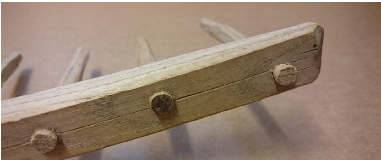
Figur 5. «Strek». Detalj fra rivehode med linje fra strekmål.