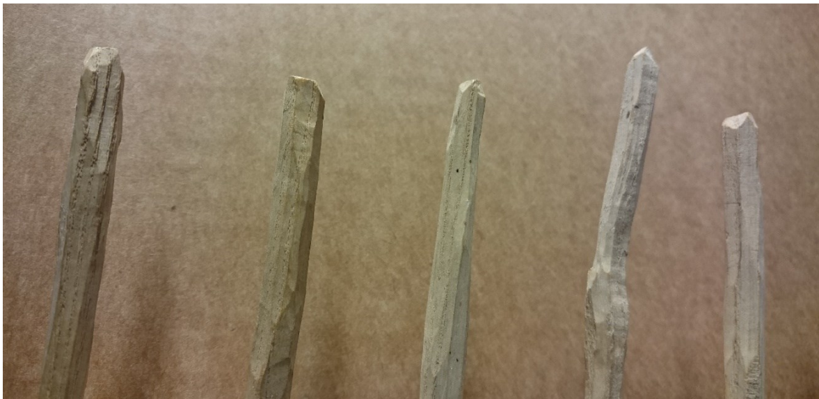
Figur 4. «Tinder». Nærbilde av rivetinder i ask.

Riven har hull til 16 tinder, 12 av dem er på plass. Hver tind er 10 centimeter lang. Det vil si, den lengste er 101 millimeter, den korteste er 92. Alle er lagd ut fra en tanke om likhet, men ikke mer enn nødvendig. Riven fungerer med noe avvik, og ved behov kan tindene justeres senere. Ser en på dem enkeltvis, er de ikke lenger så like. De to midterste har en dobbel funksjon. Ved siden av å samle høy som de andre, så fester de også skaffet til hodet. Noen tinder er nesten helt rette, andre er litt bøyd. På hver tind er det fasetter etter kniven som har spikket dem til. De minner om Bård Breiviks søyler. Hver søyle bærer sin bær for fellesskapet, men hver for seg er de unike. Min mor har fortalt om kvelder i barndommen. De satt på kjøkkenet. Min mormor sydde, min morfar spikket rivetinder.