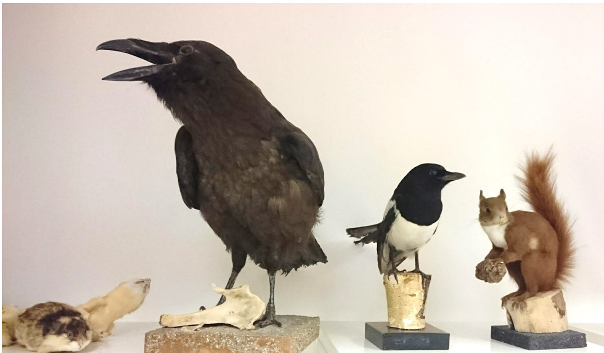
Figur 3. «Rommet ved siden av, nært men fjernt». Utstoppede dyr fra naturfagavdelingens lager på Høgskulen på Vestlandet.

Fagområder blir koblet sammen til fordel for andre: kunstfag for seg, realfag for seg, språkfag for seg. Men hva er et kunstfag og hva er det ikke? Jobber ikke alle fag med språk? Påvirker ikke naturens lover all menneskelig virksomhet og forståelse? På navneskiltet utenfor cellekontoret mitt står det institutt for kunstfag. I rommet ved siden av ligger det et lite lager. Her er det utstoppede dyr og skjeletter, men til den døren må man ha et annet nøkkelkort: Feil fag, feil institutt. I Quicchebergs teater hadde gjerne ikke veggen mellom rommene vært der i det hele. Vi mennesker trenger våre systemer, men når noe blir valgt, blir noe annet valgt bort. Er dette permanent? Hva skal til for at en inndeling eller en tenkemåte blir erstattet av en annen?