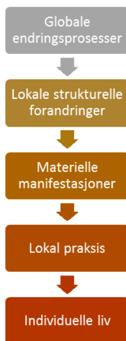
Figur 1: Påvirkningskjede fra globale endringer til individuelle liv knyttet til sted og rom